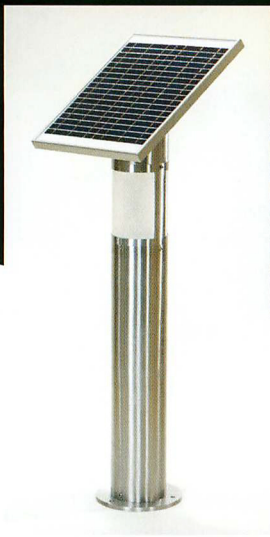
GDシリーズ R2タイプ USF-GD-021-06

完全独立電源のため、 設計や配線工事が大幅軽減。 景観を損ねないシンプルな外観に仕上げました。